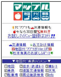
『マップル地図ナビ乗換』TOPページ画面

『マップル地図ナビ乗換』は、2008年4月25日（金）～5月6日（火）の期間中、「お試しキャンペーン」を実施します。同期間中に初めて「お試しマイメニュー登録」をされる方が対象で、登録日から30日間、バージョンアップした「マップル地図ナビ」アプリや渋滞情報、おでかけ情報の他、「地図」・「乗換案内」・「時刻表」・「運行情報」など、全ての機能が無料でご利用頂けます。