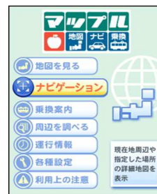
「マップル地図ナビ」アプリ画面